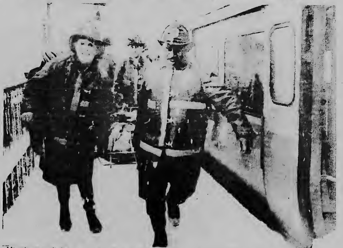
Miembros del brandweer a salir inmediatamente pa bai yuda despues que dos tren a dal den otro den un tormenta de nieve na Boston, Mass. Un di e trennan tabata biniendo di Rapid Transit y a dal tras di un qu tabata pará riba rieles. Mas qu 150 persona a ser heridá.